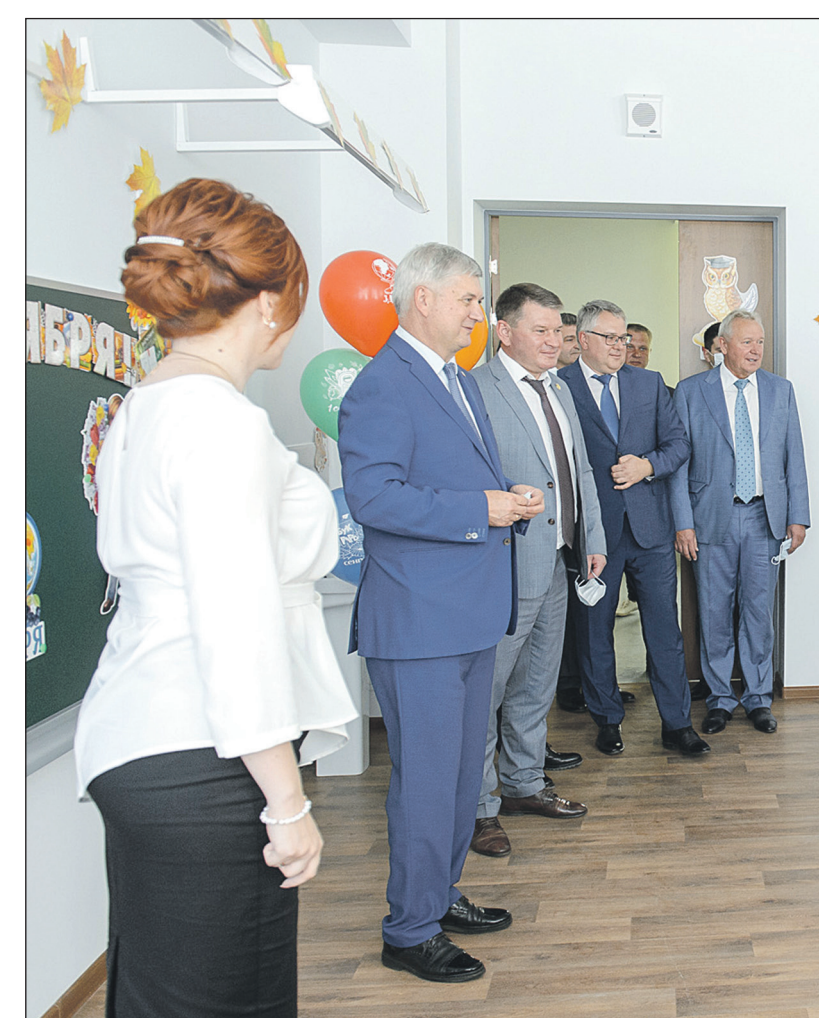
Губернатор Воронежской области Александр Гусев и глава Рамонского района Николай Фролов на открытии школы в селе Ямное 1 сентября 2020

В социально-культурной сфере важнейшими стали открытие трёх новых образовательных учреждений, капитальный ремонт Дома культуры и спортивного комплек-