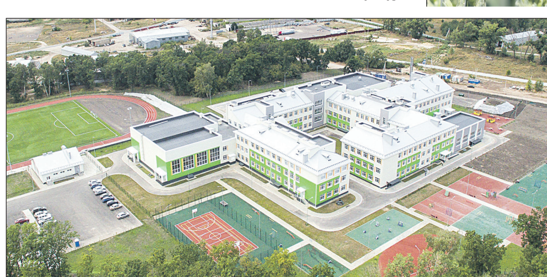
Школа на 100 мест в селе Ямное.