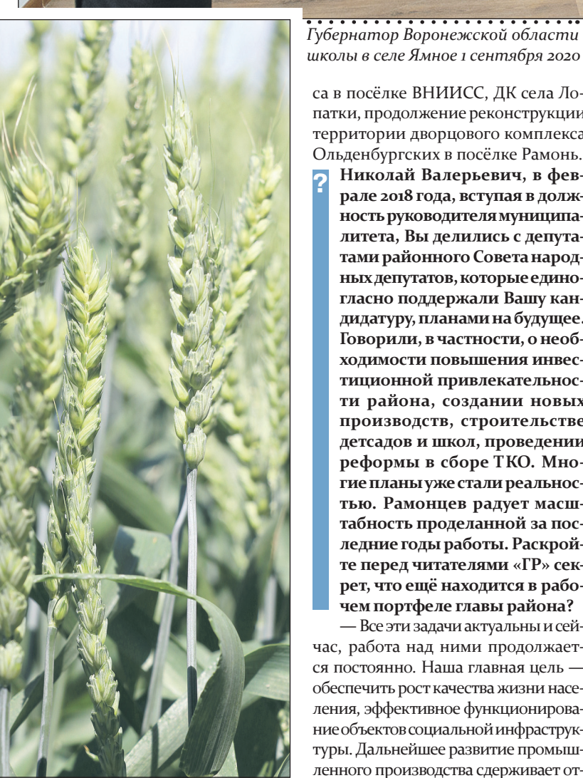
В этом году рамонские аграрии получили небывалый в истории района урожай зерновых.