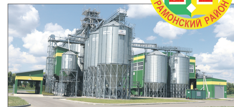
Завод по производству семян зерновых и зернобобовых культур в посёлке Комсомольский

— Положительная динамика прироста населения отмечается с 2018 года, но, в основном, за счёт миграции. Удобная транспортная доступность, близкое расположение к городу, богатая природа — всё это относится к преимуществам нашего района. В